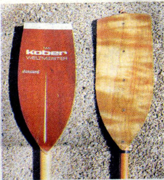
パドルのブレード

いる岩礁群があり、船体また波が出きしたが、北布を破られないように慎重に迂回(うか)りする。約10分後、岬(さき)の浦漁港を通過。この辺りからようやく波も安定している。各部のバドルは、パドルの流し、形状、素材は木、ア