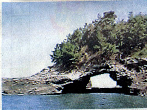
住吉崎の海岸洞穴