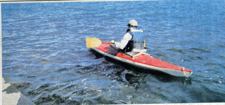
国見町岐部港を出発するK氏

約17分後、直前の海面に突き出た支柱群に注意しながら、長瀬漁港を通過。直後に白波が立つて